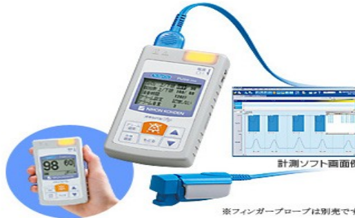
※フィンガープローブは別売です